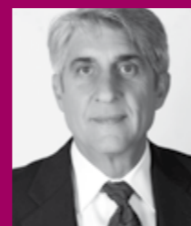
Lucien SALEMI Comité des Régions