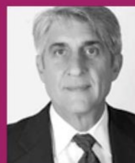
Lucien SALEMI Comité des Régions